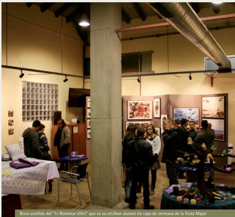
Bona acollida del "1r Remenat d'Art" que es va celebrar durant els caps de setmana de la Festa Major