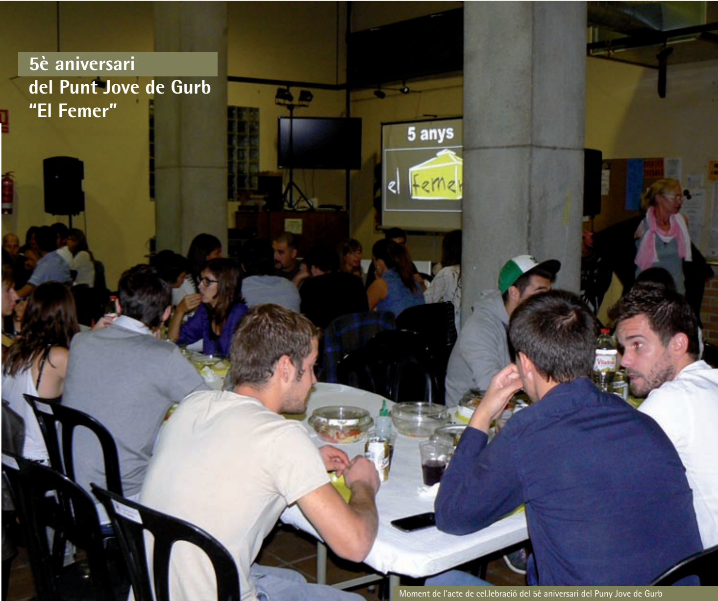
Moment de l'acte de celebració del 5è aniversari del Punt Jove de Gurb

La festa va començar a les 9 del vespre amb el sopar popular, després es van fer els parlaments i en acabar-los es va projectar en una pantalla gegant el vídeo de les activitats realitzades durant els últims cinc anys. Es va obsequiar a tots els assistents amb culotes i calçotets del Punt Jove de Gurb. Seguidament vàrem gaudir de l'espectacle del genial humorista Salomón, que no va deixar indiferent a ningú, i va aconseguir que regnés el silenci, només trencat per les rialles del públic.