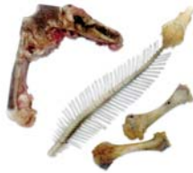
Restes de carn i peix

Posa les restes orgàniques al cubell marró i, sobretot, dins una bossa compostable.