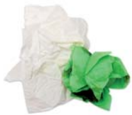
Paper de cuina brut de menjar