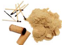
Taps de suro, llumins i serradures