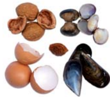
Cloques d'ou, de marisc i de fruita seca