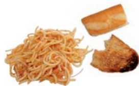
Restes de menjar cuinat i pa sec