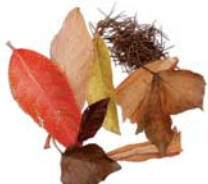
Restes de plantes

La recollida de les restes orgàniques es realitzarà mitjançant contenidors al carrer.