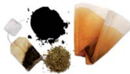
Marro de cafè i restes d'infusions