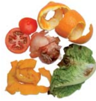
Restes de fruita i verdura