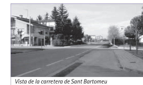
Vista de la carretera de Sant Bartomeu

Amb aquesta mesura es pretén reduir la velocitat dels vehicles que circulen per aquest