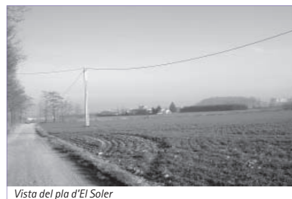
Vista del pla d'El Soler

El Ple de l'Ajuntament del dia 21 de novembre de 2002 va acordar l'aprovació inicial del projecte de reparcel·lació del Sector 5, corresponent a la zona de la carretera de Sant Hipòlit i en la sessió plenària del dia 19 de desembre es va aprovar també inicialment el projecte de reparcel·lació corresponent al pla parcial El Soler-1. Actualment els dos projectes estan en el tràmit d'informació pública i, posteriorment, s'aprovaran definitivament. Una vegada fet això ja es podrà elaborar el projecte d'urbanització.