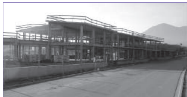
Estat actual de les obres de construcció de l'escola

El 27 d'octubre passat es va fer una festa per celebrar entre tots la posada simbòlica de la primera pedra de la nova escola i de la llar d'infants de Gurb, que des de l'estiu s'estan construint al barri de Prixana.