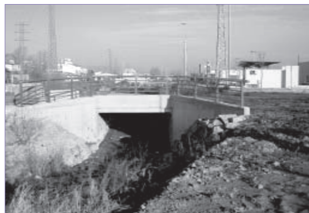
En breu finalitzaran les obres de construcció del pont

Per tal d'unir el polígon industrial Mas Galí, de Gurb, amb el polígon industrial de Sot dels pradals, de Vic, els dos municipis van acordar construir conjuntament dos ponts al torrent de l'Esperança. Un dels ponts ja està acabat però l'altre, que enllaça amb la carretera de Sant Hipòlit, ha estat aturat un temps per problemes en l'execució de l'obra. De tota manera, l'Agència Catalana de l'Aigua està fent les actuacions pertinents, inclosa la substitució d'un tram del col·lector Vic-Nord, i s'espera que en un termini curt de temps es pugui enllestir l'obra.