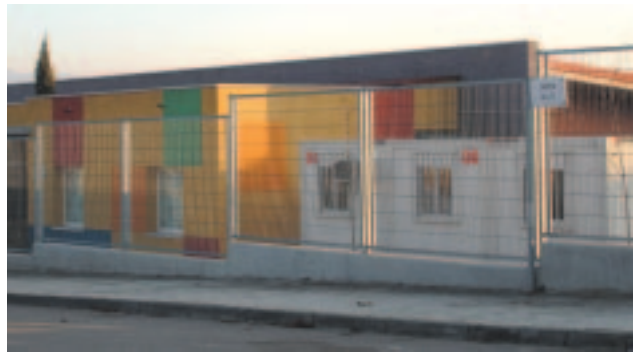
La llar d'infants de Gurb, inaugurada l'any 2002

En cap cas, però, es preveia que hauríem de parlar d'aquest tema tan aviat. Actualment la llar d'infants està al límit de la seva capacitat i a l'escola, els