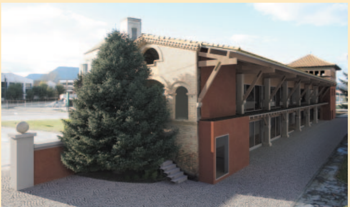
Imatge virtual de l'edifici refomat on s'ubicaran els nous equipaments

Fruit d'aquestes gestions, el Departament de Salut aportarà 125.000 € per al Consultori mèdic i pel que fa a la resta de departaments o bé encara no han respost oficialment o bé la resposta ha estat negativa. De tota manera, no es preveuen grans aportacions. En qualsevol cas, la part de les obres no subvencionades es finançarà amb fons de l'Ajuntament i amb la venda de patrimoni.