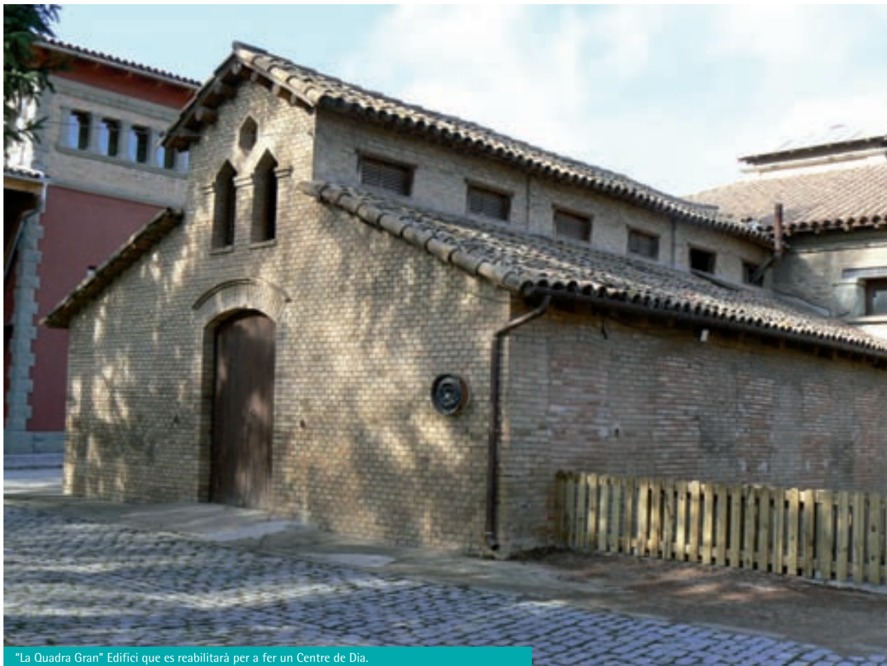
"La Quadra Gran" Edifici que es rehabilitarà per a fer un Centre de Dia.

Amb el nou Fons Estatal d'Inversió Municipal, l'Ajuntament ha acordat destinar-ne el 80% a la rehabilitació de la "Quadra Gran" per ubicar-hi un Centre de Dia. Aquest edifici, situat en el recinte de l'Esperança, entre el Casal de la gent gran i el Teatre, té una superfície de 110 m 2 i fins fa poc s'utilitzava de magatzem i està força deteriorat. La reforma serà integral i en consonància amb tot el recinte de l'Esperança. Es rehabilitarà tota l'estructura i s'hi faran les obertures que antigament hi havia, tot conservant-ne l'estructura actual.