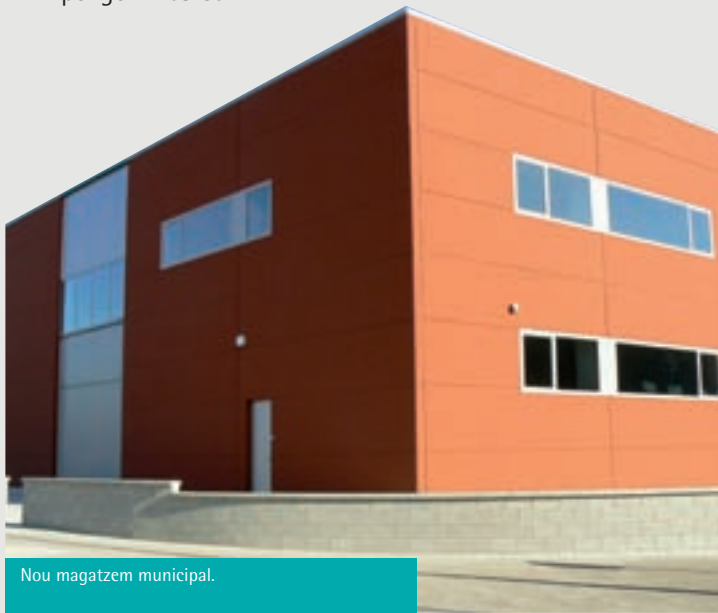
Nou magatzem municipal.

Té una superfície de 285 m 2 de planta i un entresolat de 135 m 2 , que es distribuïran en diferents departaments per a magatzem i arxiu per a l'Ajuntament i, si cal, també per a entitats. És de fàcil accés, amb portes grans a l'entrada i a la sortida al davant i al darrera que permeten poder carregar i descarregar sense necessitat de maniobrar. Està ubicat al polígon Mas Galí.