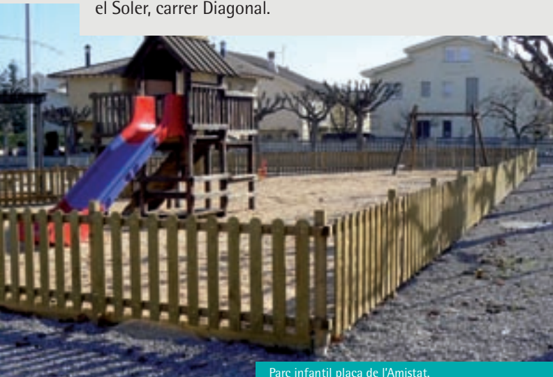
Parc infantil plaça de l'Amistat.

Gurb ha fet un pas important en equipaments públics destinats als més petits, repartits per totes les zones urbanes: Serrabonica, carrer de Sant Roc, davant de les Escoles, plaça de l'Amistat, el Soler, carrer Diagonal.