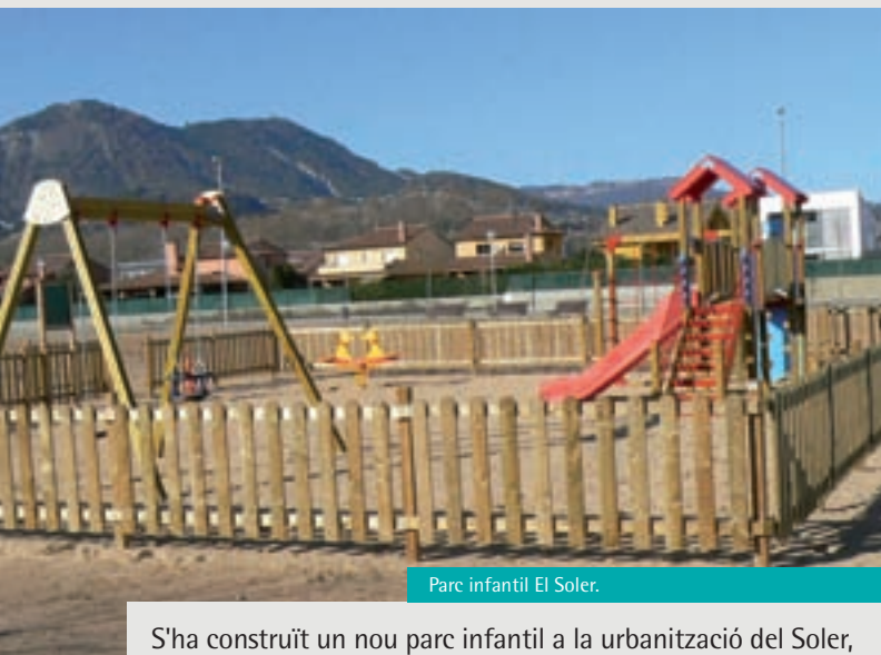
Parc infantil El Soler.

S'ha construït un nou parc infantil a la urbanització del Soler, s'han remodelat i ampliat els de la plaça de l'Amistat i el del carrer Diagonal i s'ha construït una sorrera davant la Il·la d'infants.