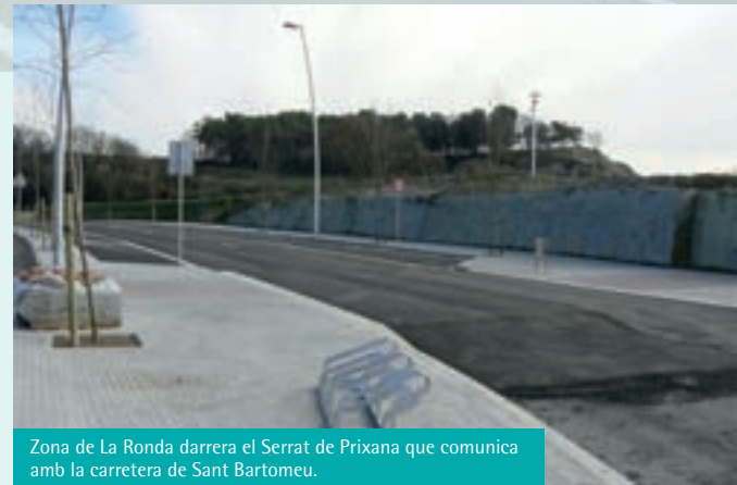
Zona de La Ronda darrera el Serrat de Prixana que comunica amb la carretera de Sant Bartomeu.

Concretament la primera fase consistirà en la urbanització i millora del tram que va des de la rotonda de l'Esperança (Ajuntament) fins a Can Violi (de la qual ja hi ha una part finalitzada), és a dir, el lateral dret de la carretera de Sant Bartomeu; i pel lateral esquerre es mantindrà i millorarà el carril bici fins al Pavelló i és remodelaran únicament les zones urbanitzades, les de davant els carrers Colon, de Sant Jordi i de Sant Roc, i el tram que va des del carrer de Ginebrar (L'Armengol)