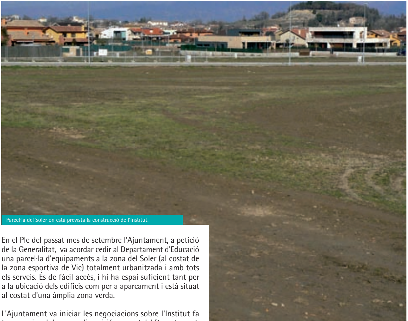
Parcel·la del Soler on està prevista la construcció de l'Institut.

El passat mes de desembre el Departament d'Educació va publicar al Diari Oficial de la Generalitat (DOG) l'oferta educativa del nou centre de Gurb (SES Gurb 08068380), el qual s'ubicarà a la zona prevista del Soler en aules prefabricades fins que es construeixi el nou edifici. Després d'intenses negociacions amb el Departament d'Educació, és molt possible que Gurb tingui un SES Secció Ensenyament de Secundària (ESO) que també serà per a alumnes de Sant Bartomeu del Grau i de Santa Eulàlia de Riuprimer.